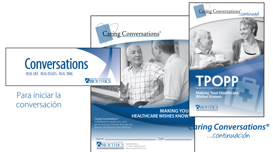
Caring Conversations ® Libreta de trabajo

Para ordenar o para obtener copias electrónicas: www.PracticalBioethics.org